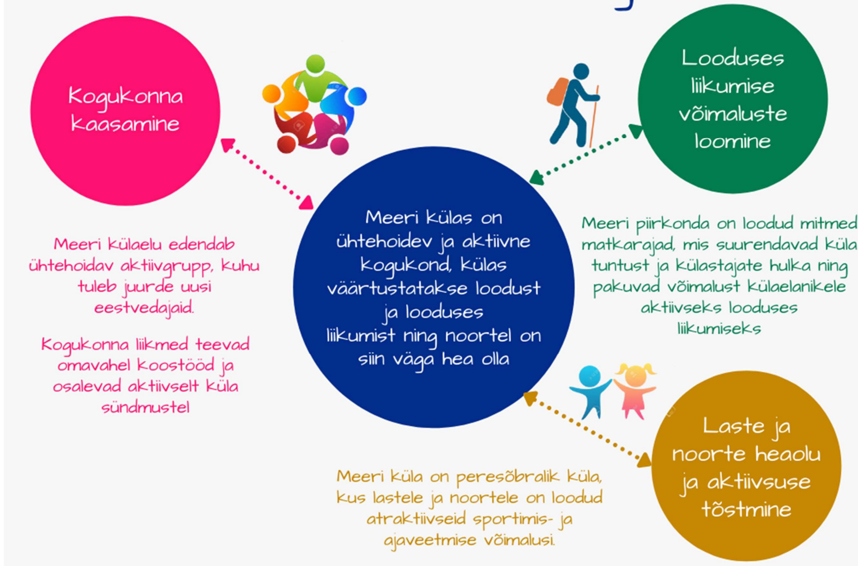
Joonis 3. Meeri küla strateegia visioon, strateegilised eesmärgid ja tegevussuunad.