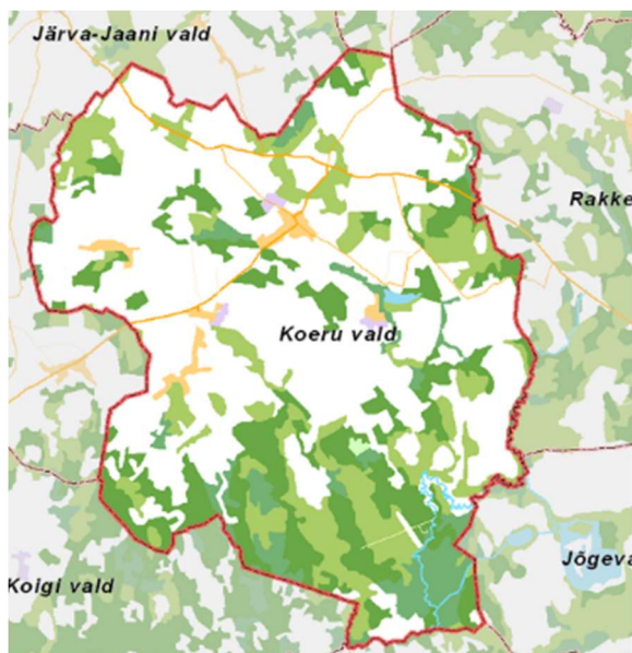
Joonis 1. Koeru piirkonna kaart

Koeru piirkond (joonis 1) suurusega 236,82 ruutkilomeetrit (mis moodustab 9% Järvamaast ja 0,5% Eesti pindalast) asub Järva maakonna idaosas Järva vallas. Koeru piirkond paikneb Pandivere kõrgustiku ja Kesk-Eesti lavamaa piirialal. Koeru kogukonna naabriteks on edelas Koigi, läänes Kareda ning põhjas Järva-Jaani piirkonnad Järva vallas; kirdes Väike-Maarja ja idas Rakke piirkond Lääne-Viru maakonnast ning kagus Jõgeva ja lõunas Pajusi piirkond Jõgeva maakonnast. Käsitletav piirkond koosneb neljast ajalooliselt väljakujunenud tihe- ja hajaasustusalaga keskusest: Ervita, Koeru, Salutaguse ja Vao.