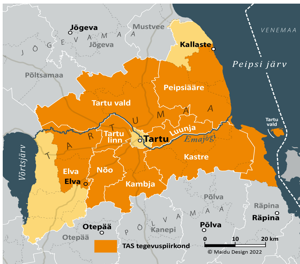
Joonis 1. Tartumaa omavalitsused ja TASi piirkond

2017. aastal toimus Eestis haldusterritoriaalne reform. Tartu maakonnas on haldusreformi järgselt kokku 8 KOVi, millest kõik kas tervikuna või osaliselt kuuluvad TASi piirkonda. Lisaks kuulub TASi piirkonda endise Meeksi valla territoorium, mis jääb haldusreformi järgselt Põlva maakonda kuuluva Räpina valla koosseisu. 2022. a seisuga ei kuulu Tartu maakonnast TASi koosseisu endine Jõgeva maakonna Pala vald (ühines Peipsiääre vallaga), kes jätkab senises tegevusrühmas (Jõgevamaa Koostöökoda) ning Elva vallast endised Rannu ja Rõngu vallad, kes kuuluvad jätkuvalt LEADER-tegevusrühma Võrtsjärve Ühendus. Kuna haldusreformi raames ühinesid Tähtvere vald ja Tartu linn on ka Tartu linn osaliselt TASi koosseisu. Võrreldes eelmise perioodiga on piirkond suurenenud Tabivere valla (nüüd osa Tartu vallast) ja Elva linna võrra (joonis 1).